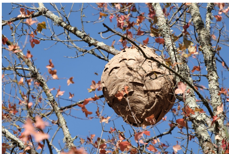
Nid ovale, entrée unique sur le côté

Selon le guide d'identification du Muséum nationale d'Histoire naturelle, les nids de frelons sont sphériques ou en forme de poire et peuvent mesurer 60 à 80 cm.